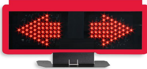
ÇİZİM - 2

Maçın başında yapılan hava atışında top kullanma hakkını elde eden takımdan sonra sırasıyla topu oyuna sokma hakkını gösterecek göstergeler ev sahibi takım tarafından sağlanacaktır.(Bknz. Çizim 2)