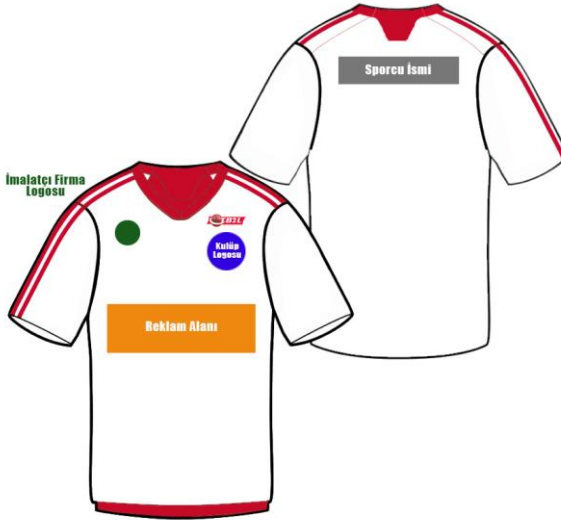
ÇİZİM - 9