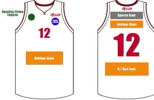
ÇİZİM - 6